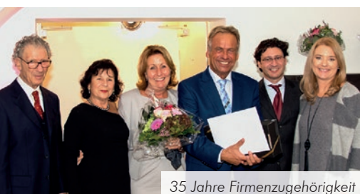
35 Jahre Firmenzugehörigkeit