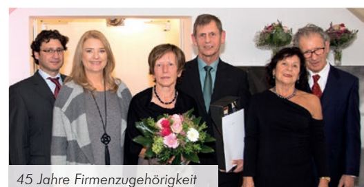
45 Jahre Firmenzugehörigkeit