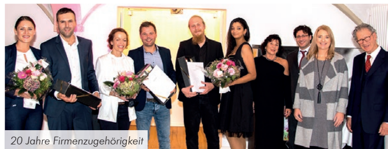
20 Jahre Firmenzugehörigkeit