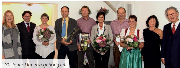
30 Jahre Firmenzugehörigkeit