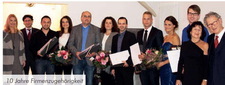
10 Jahre Firmenzugehörigkeit