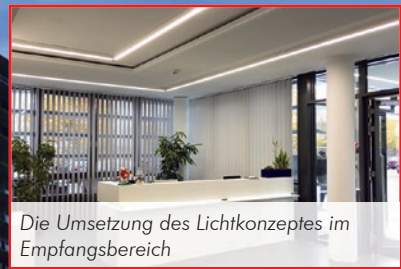
Die Umsetzung des Lichtkonzeptes im Empfangsbereich