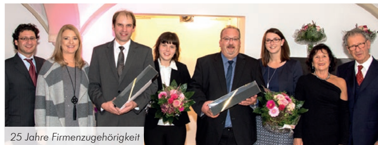
25 Jahre Firmenzugehörigkeit