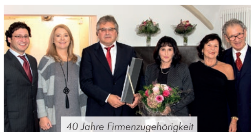
40 Jahre Firmenzugehörigkeit