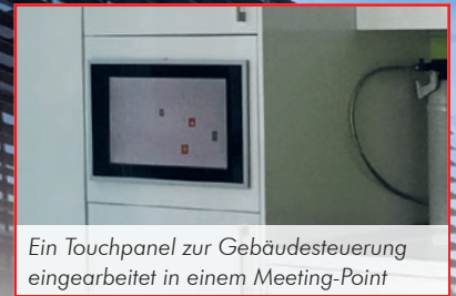
Ein Touchpanel zur Gebäudesteuerung eingearbeitet in einem Meeting-Point