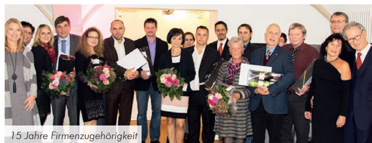
15 Jahre Firmenzugehörigkeit