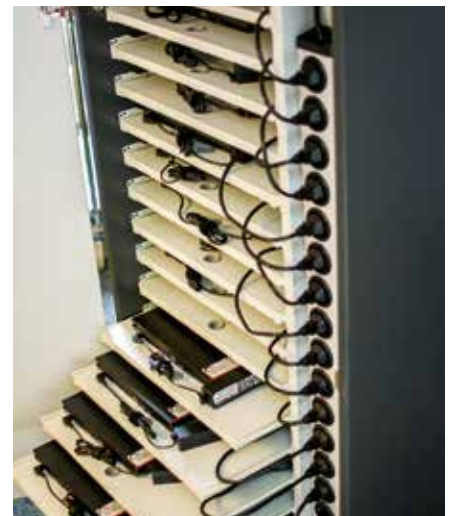
Die komplette Schulungshardware ist sauber und sicher in einem Rollcontainer verstaut.

Das komplette Kursangebot erleichtert die Arbeit in vielerlei Hinsicht. Darüber hinaus treffen Mitarbeiter aus verschiedenen Abteilungen und Niederlassungen