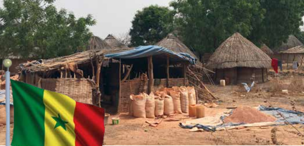
Nach Übergabe der Reisspenden folgte einer der bewegendsten Momente der Reise. Ein Gebet der Empfänger im Kreis mit Ihren Gästen.