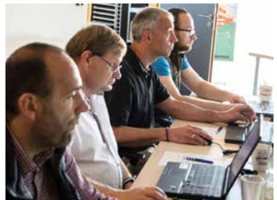
Perfekt ausgestattet mit neuen Schulungslaptops ist ablenkungsfreies Arbeiten garantiert.