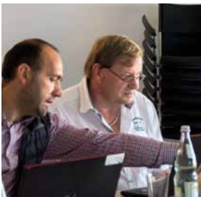
Einige Funktionen erklärt man sich auch untereinander...